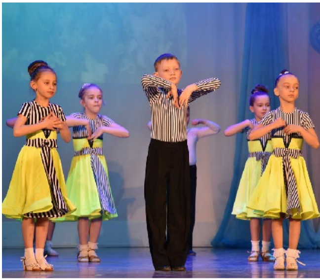
На сцене — ансамблю спортивного бального танца «Велена»