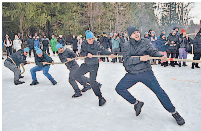
За победу борется цех № 28

ряжали позитивом номера, подготовленные вокальной группой «Звездный путь» и ансамблем народного танца «Аюшка». Настоящим сюрпризом для собравшихся стало выступление представителей Совета работающей молодежи АО «Златмаш». Так зажигательно они танцевали под «Ягоду-малинку», что остальные заводчане, да