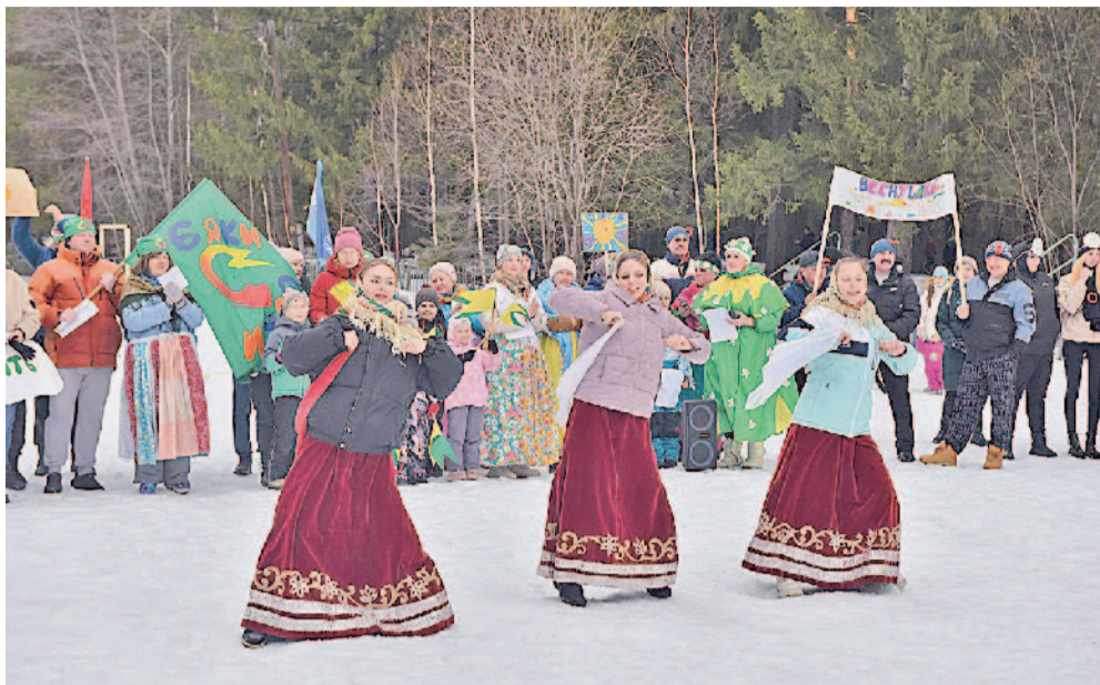
Ансамбль народного танца «Аюшка» зарядил на позитив

Весело, ярко, с огоньком проводил зиму коллектив Златоустовского машиностроительного завода. По многолетней традиции заводчане встретились на спортивной базе, на природе, чтобы в неформальной обстановке пообщаться, отдохнуть, повеселиться, принять участие в шуточных состязаниях и зарядиться энергией на новую рабочую неделю.