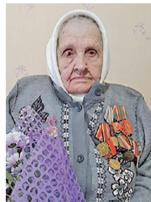
В день своего столетия

области, и в этом юбилейном для Златмаша году отметила свой вековой юбилей. В 1943 году была эвакуирована в Златоуст, где устроилась работать на Златоустовский машиностроительный завод. Работала в оружейном производстве фрезеровщиком, принимала участие в выпуске пулемета «Максим» и охотничьих ружей. Проработала на заводе 33 года.