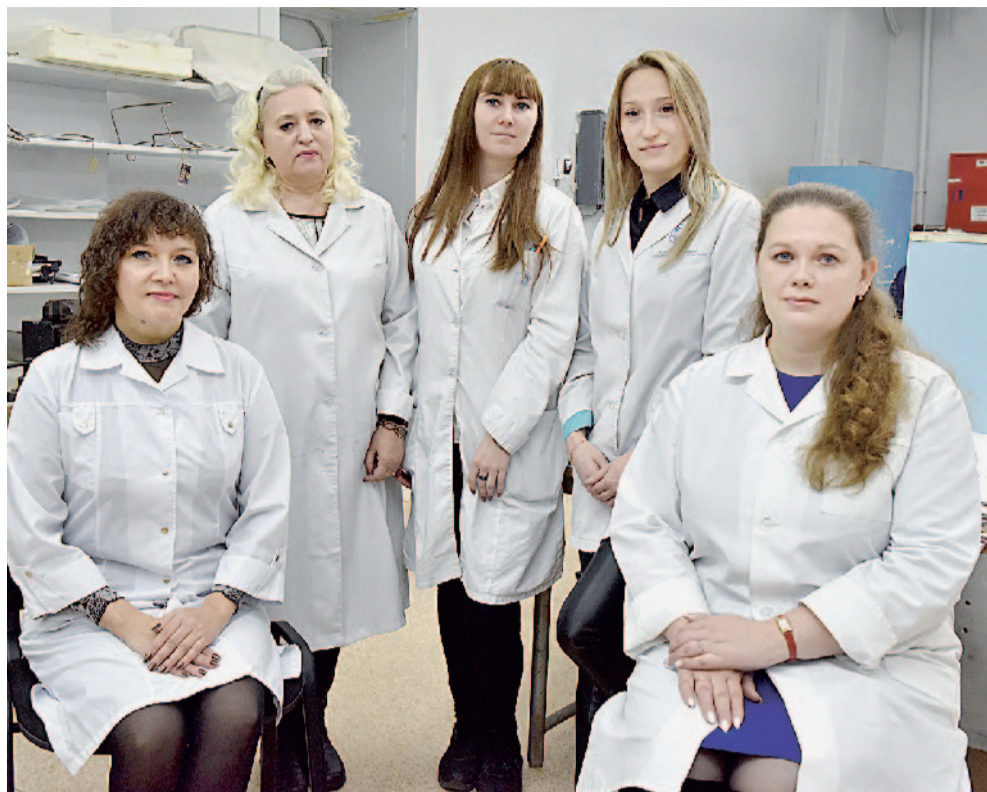
Коллектив бюро технического контроля цеха № 69