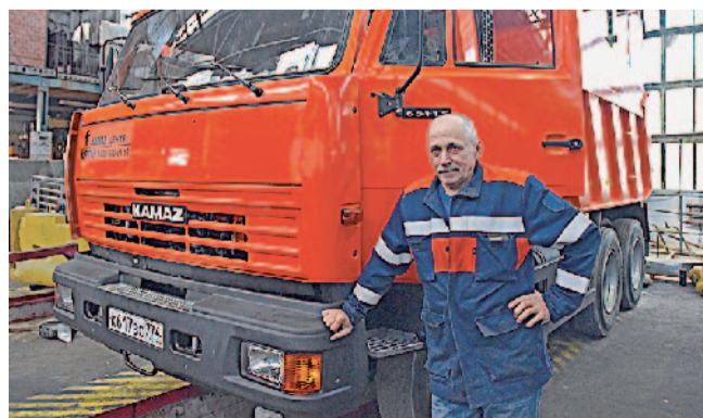
В подарок к профессиональному празднику — новенький «КамАЗ»