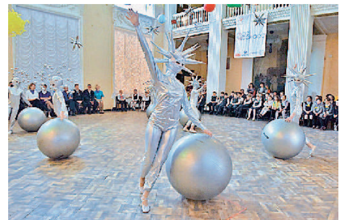
Выступления творческих коллективов Дворца Победы стали украшением «Дней Роскосмоса» в Златоусте.