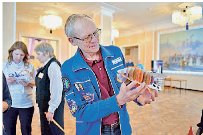
Лётчик-космонавт Сергей Авдеев рассматривает выставку детской работ.