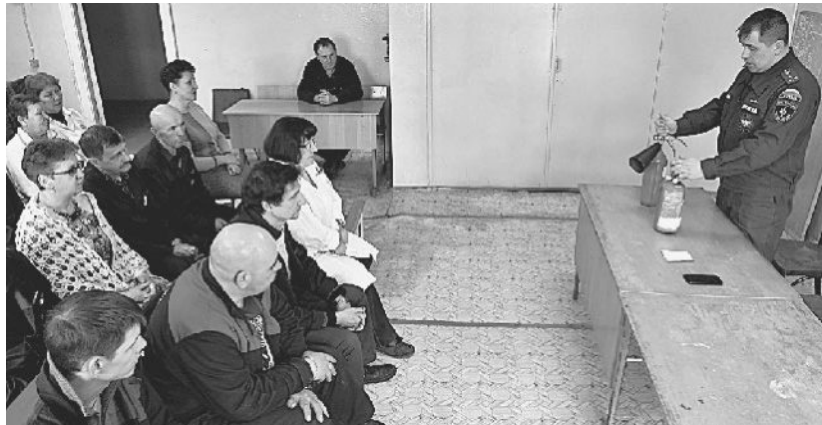
ДЕЛАЙ ТАК! Идут занятия по противопожарной безопасности в цехе № 28.

К сожалению, многие забывают, что после таяния снега и ухода талой воды резко возрастает пожароопасная обстановка. Беспечное, неосторожное обращение с огнём при сжигании сухой травы, мусора на территории дач, домиков зачастую оборачивается бедой — это почти 20% всех пожаров, происходящих ежегодно именно по этой причине. Каждый год весной горят хозяйственные постройки и жилые дома граждан города, а так же дачи.