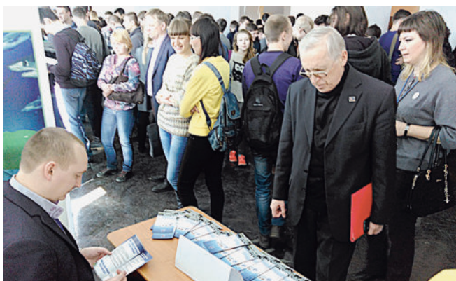
Экспозиция АО «Златмаш» привлекла внимание участников форума.