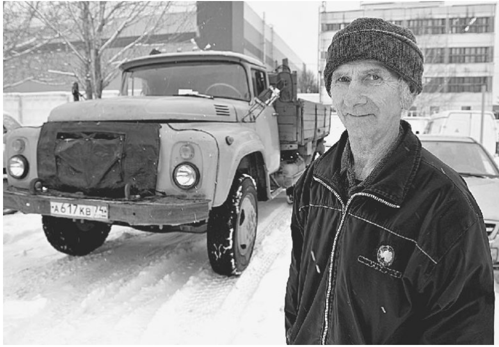
Бывалый ЗИЛок своего хозяина не подводит.