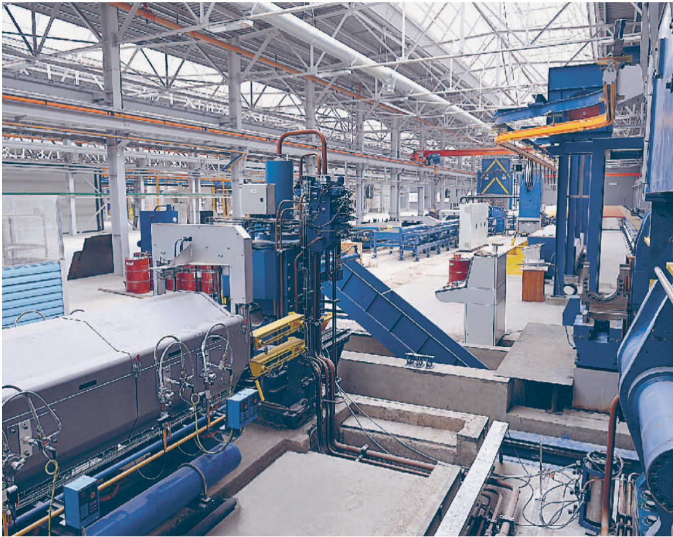
Установлена испанская автоматизированная линия прессования на базе прессы «GiA Clecim Press» усилием 1800 тонн.