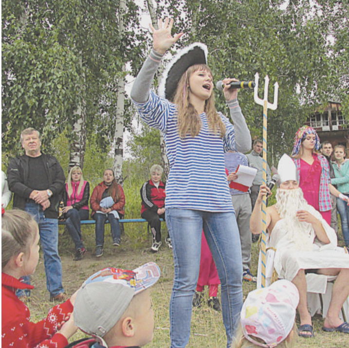
«Оставайся, мальчик, с нами — будешь нашим королём...»