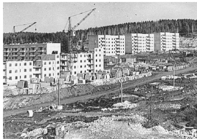
Строительство 4-го микрорайона.