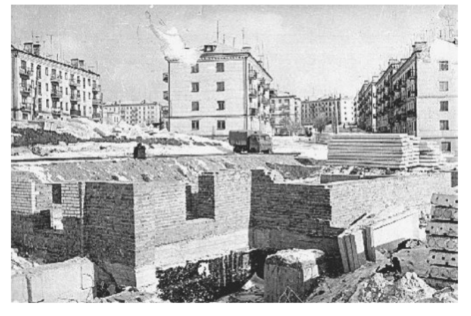
Закладка первого девятиэтажного дома в Новом Златоусте.