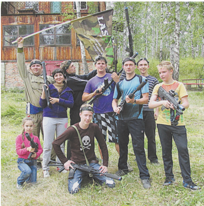
ОТСТРЕЛЯЛИСЬ! Команда-победитель в «LAZERTAG».

Второго августа на базе «Аргазы» прошёл праздник Нептуна, посвящённый Дню ВМФ. Его участниками стали заводчане, которых не испугала дождливая златоустовская погода.