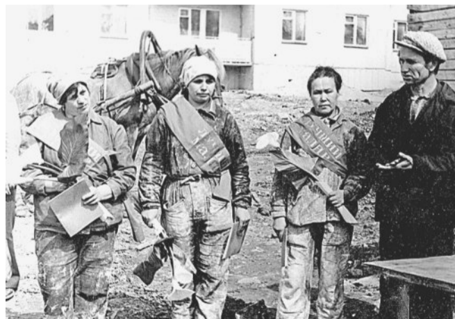
Победители конкурса маляров. 1980 год.