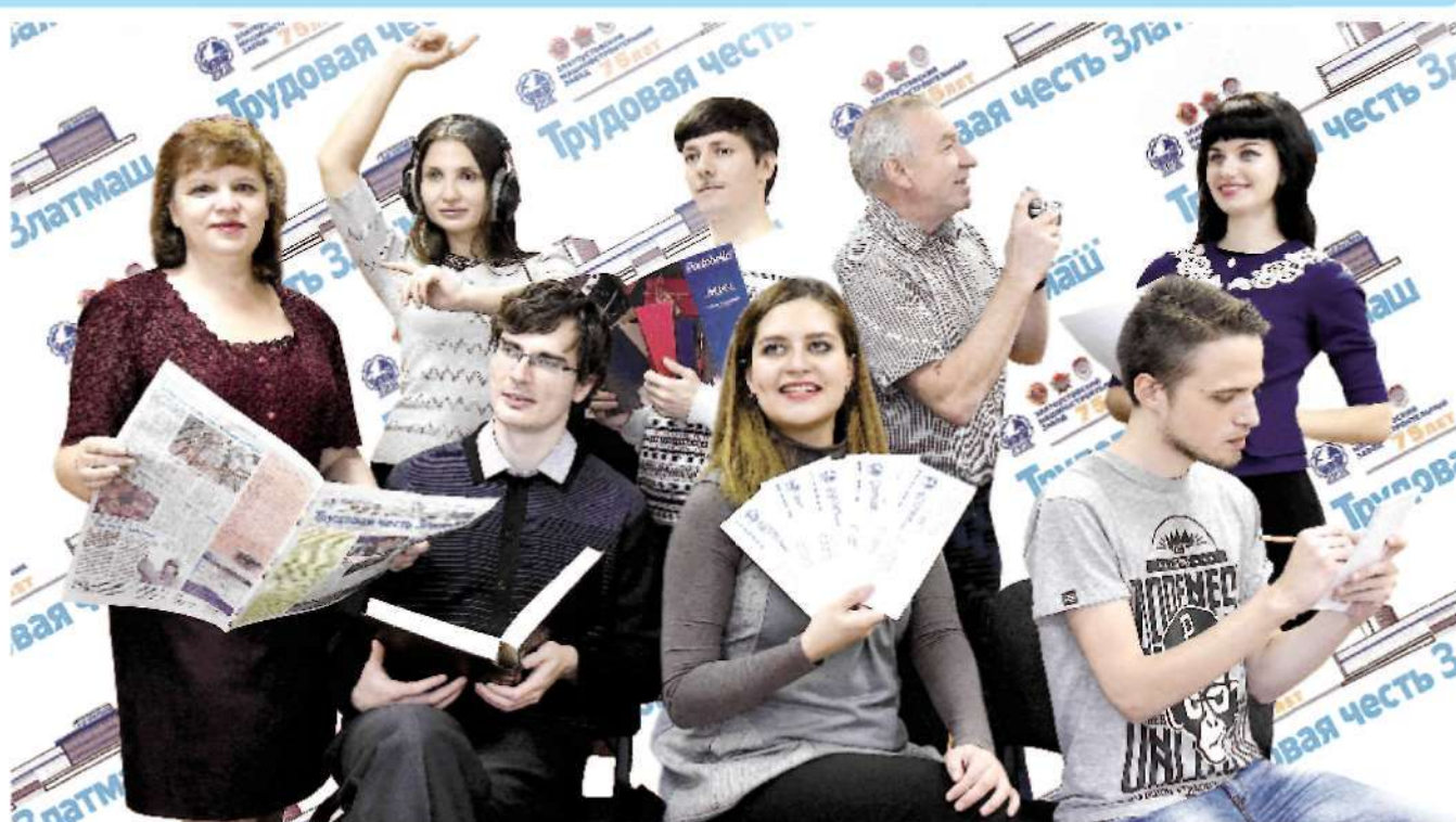
ПРЕКРАСЕН НАШ СОЮЗ!