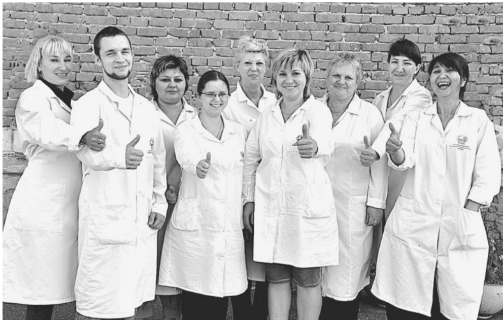
В РАБОЧЕМ КОЛЛЕКТИВЕ. «Новобранцы» и опытные электромонтажники цеха № 69.