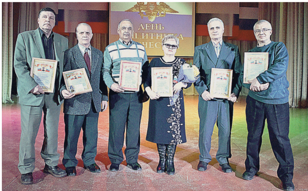
Награждённые медалью «Первый в мире человек в открытом космосе — Леонов Алексей Архипович».