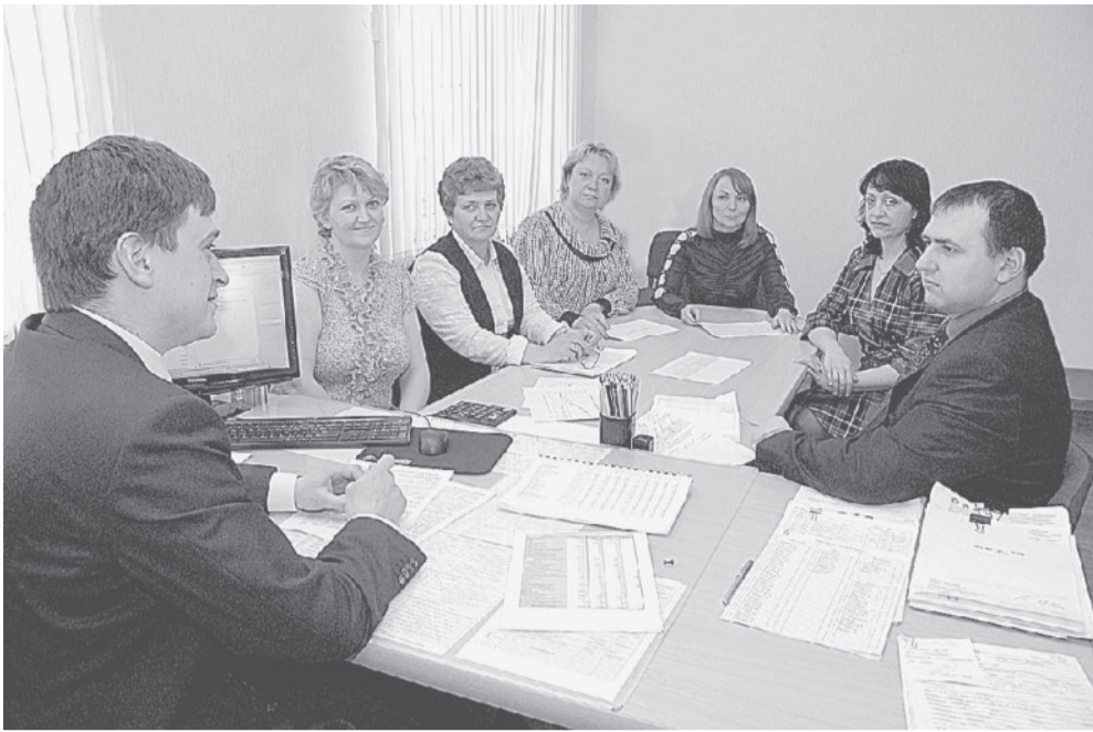
РАБОЧИЙ МОМЕНТ. На планёрке «капитаны» ПЭО обсуждают экономический курс предприятия.

75 Трудовая честь Златмаш ЮБИЛЕЙНЫХ ИСТОРИЙ