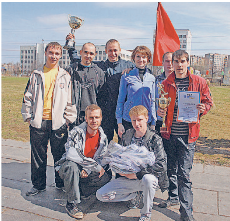
КУБОК НАШ! Главную награду – Переходящий Кубок газеты «Трудовая честь Златмаш» завоевала команда отдела № 234.