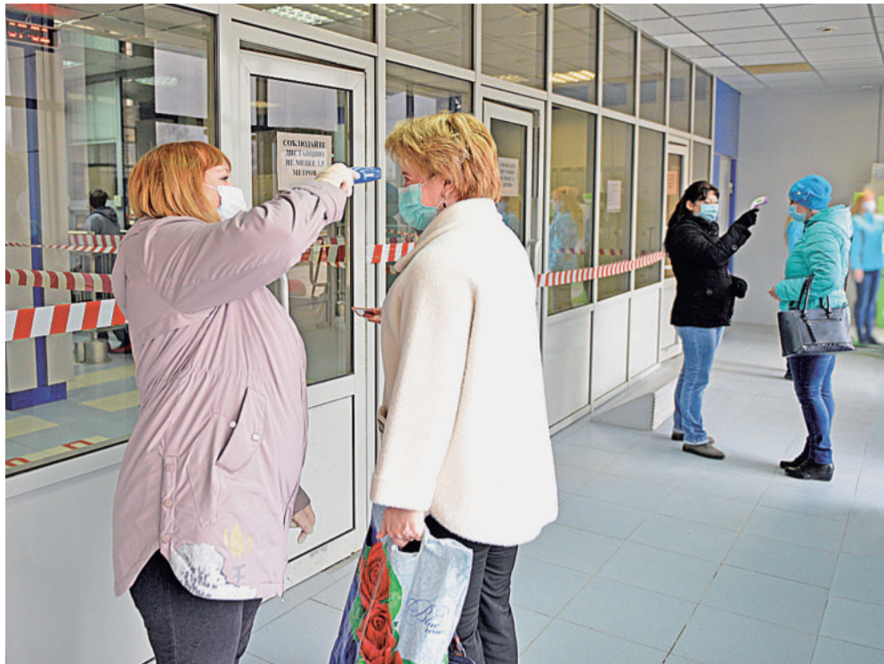
На заводской проходной контроль особьей.